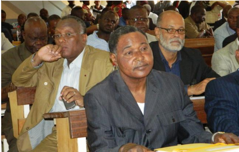
Une vue partielle des participants à la concertation

Plus d'un an après les recommandations prises à Ewo, couronnées par la période d'essai avant, pendant et après les législatives de l'an dernier, il était nécessaire de s'arrêter pour évaluer le processus de mise en œuvre de ces résolutions. Il fallait exhumer le passé pour analyser le présent afin de prévoir l'avenir. L'exercice a pris plus de temps que prévu, tant la recherche du consensus ne pouvait en décider autrement. Le point du ministre de l'intérieur et de la décentralisation indique que neuf des