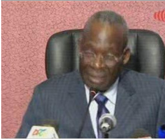
Le ministre d'Etat Florent Ntsiba interpellant les enseignants

A propos de l'application des accords du 05 août 2010 , le comité, après avoir adopté le document, a néanmoins décidé : de reprendre les activités du