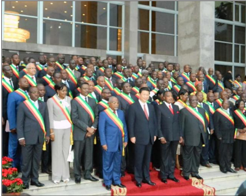
Photo de famille avec le parlement réuni en congrès

De même, la coopération déjà fructueuse entre le Congo et la Chine dans le domaine de la communication a été renforcée par un nouvel accord. Selon le ministre de la communication,