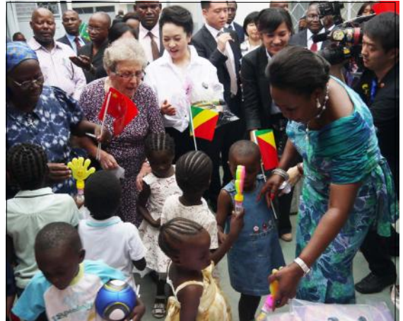
Distribution des jouets à l'orphelinat Béthanie par les deux 1 ères dames