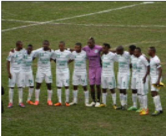
AC Léopards ou ça passe ou sa casse

Au démarrage des compétitions africaines des clubs les espoirs congolais reposaient sur les « Fauves » du Niari. Normal. A